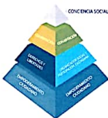
Figura 2. Democracia para la convivencia Perspectiva 2