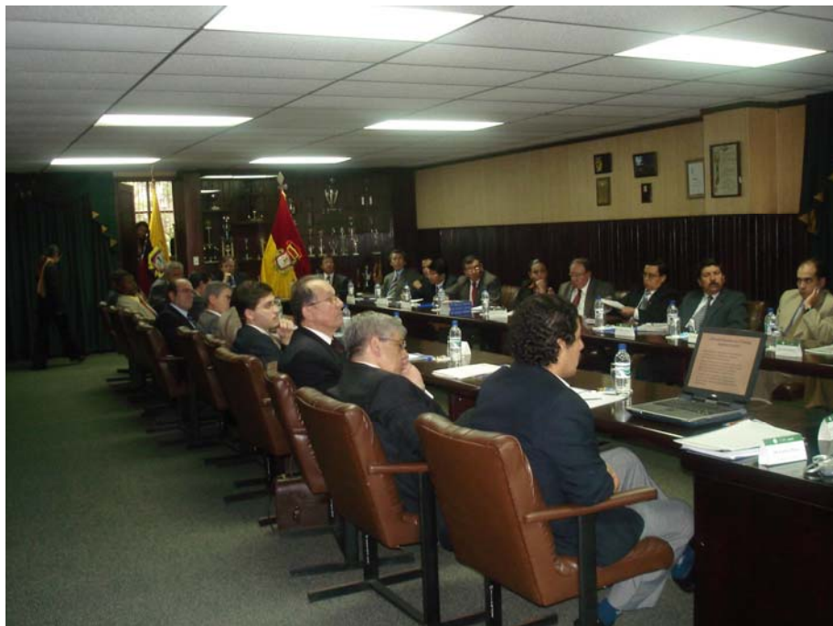
Asistentes al Evento en la Sala del Consejo Universitario de la Universidad del Azuay