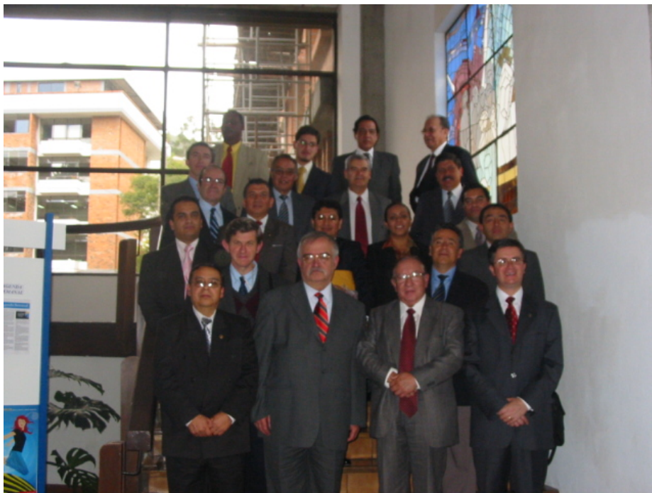
Grupo Proyecto Tuning Derecho Ecuador